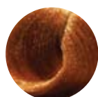
85 blond cuivré vénitien