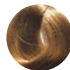
79 blond naturel