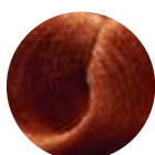
86 blond orange intense